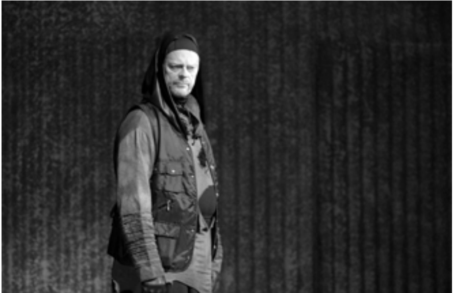
RICHARD III. | MARTIN STRÁNSKÝ